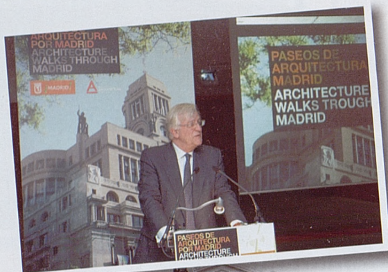
Presentación de los "Paseos de Arquitectura de Madrid" y afluencia de público en el paseo "Mirando al cielo".

La Semana de la Arquitectura sirvió de marco para la presentación de los itinerarios organizados por la Fundación Arquitectura COAM junto a la Empresa Municipal Promoción de Madrid, que suponen una nueva mirada sobre la ciudad: "Paseo del Arte" , a través de la arquitectura del Paseo del Prado, "Madrid Verde" , por los paisajes urbanos de Madrid, y "Mirando al cielo" .