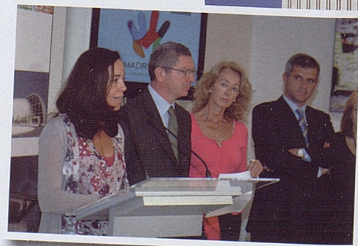
Inauguración de la exposición "Madrid 2016".